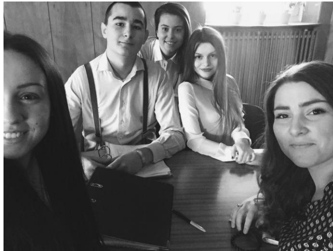
Prezidentka a viceprezidenti

Výpočet: 52,20 € / 16 zamestnancov = 3,26 € / 13 dvojhodinoviek = 0, 25 € mzda za 1 dvojhodinovku