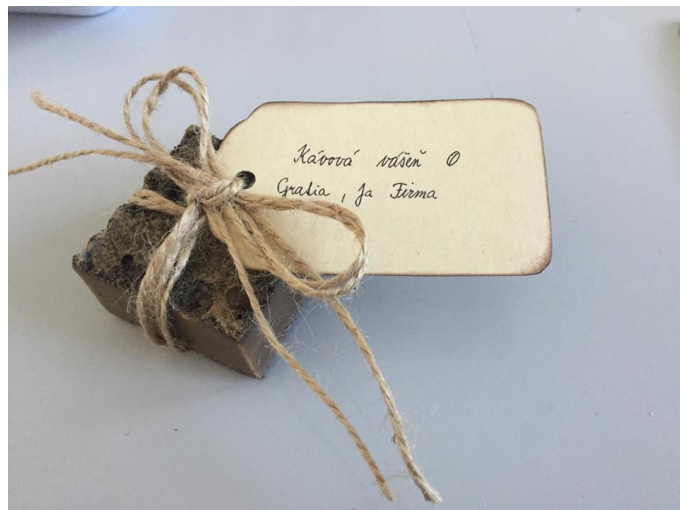
mydlo Kávoová vášeň