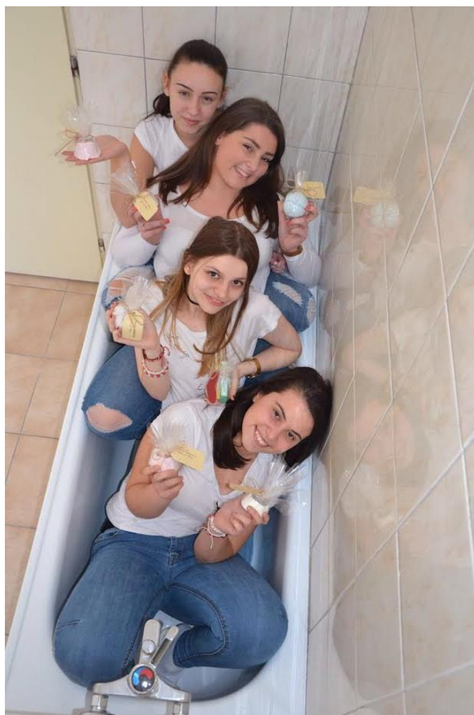
tím smerujúci do Košíc

Ako tím sme spolu vytvorili originálne produkty a pri ich výrobe sme mali naozaj zábavu. Veríme, že naši akcionári budú spokojní s našim hospodárením.