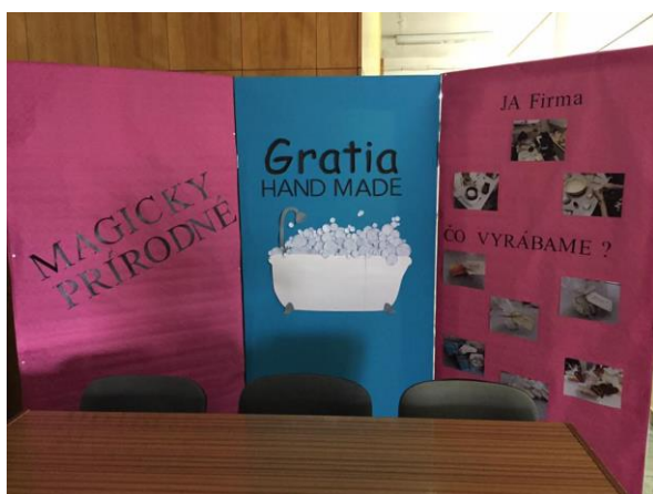
Náš stánok na DOD

Na DOD na Obchodnej akadémii v Pezinku sme mali vyhradený priestor na prezentáciu a náš stánok, kde sme detailne záujemcom vysvetlili účel a fungovanie produktov, ktoré si mohli hneď kúpiť.