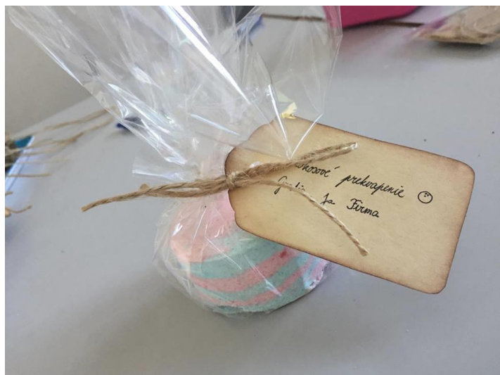
šumivá bomba Kokosové prekvapenie