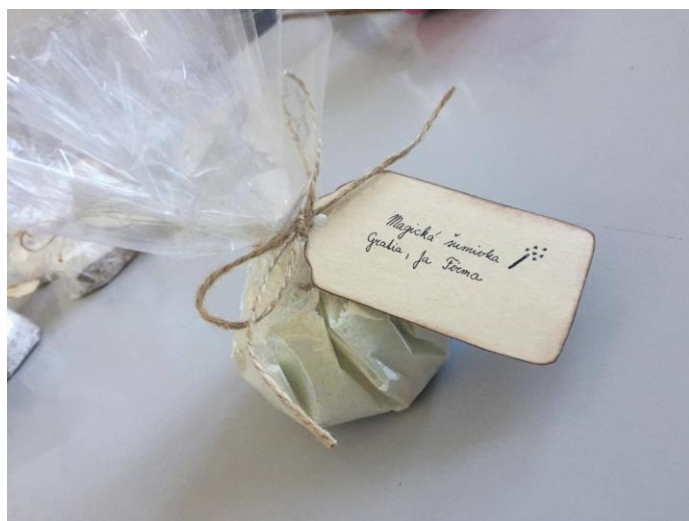
šumivá bomba Magická šumivka