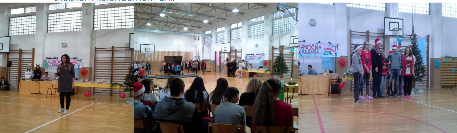
Obrázok 5 Vianočná akadémia

Každoročne sa organizuje Vianočná akadémia, ktorú si tento rok pre žiakov a pedagógov našej školy pripravili JA Firmy Interra v spolupráci s JA Firmou Aventure. V rámci Vianočnej akadémie vystupujú študenti s pripravenými scénkami. Vianočná akadémia sa uskutočnila 22. 12. 2016 v poslednom školskom kalendárnom dni.