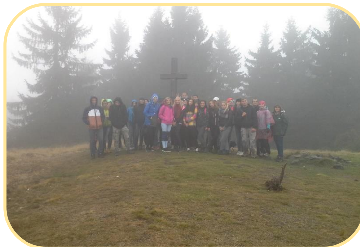
Obrázok 9, 10 Exkurzia Kysuce