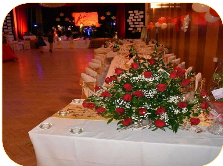
Obrázok 6 Výzdoba sály