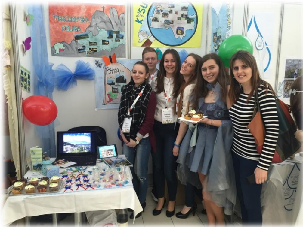
Obrázok 2 Manažérsky tím